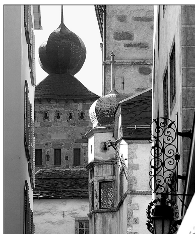
Brig – bei Gästen immer beliebter.